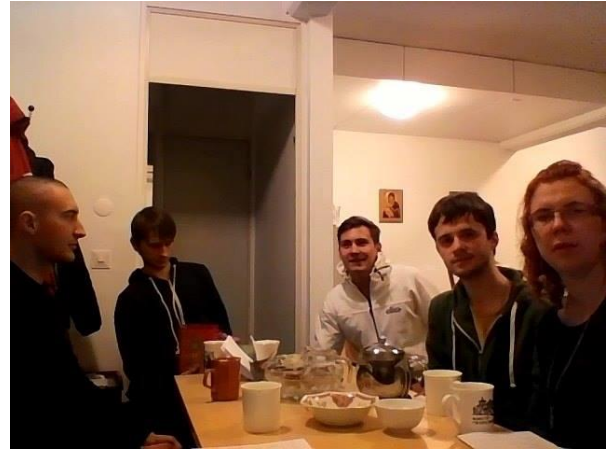
Hallitus & muita koolla, 24.2.

Hallitus kokousti 24.2. ja 6.9. Keskustelu ja ideointi sähköpostin tai muiden elektronisten kanavien kautta muodostui vilkkaaksi, jopa käytännölliseksi. Epävirallisia tapaamisia hallitusten jäsenten ja/tai työntekijöiden välillä sattui verrattain tiheästi Keskustoimistolla.