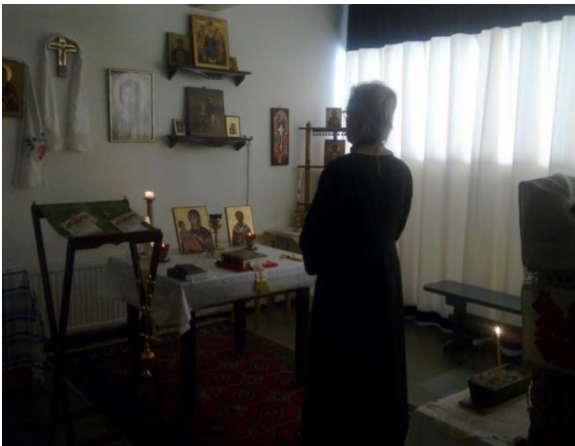
Isä Pekka & VI hetki online 6.9.

Aika ajoin Keskariteki ekskursioita kampukselle, eritoten HY Teologiseen tiedekuntaan, josta useimmiten tarttui mukaan uusia kasvoja. Ylipäänsä vierailijoiden tausta on muodostunut kirjavaksi: Keskarilla on käynyt herätysliikkeisiin tai helluntailaisiin kallellaan olevia taikka valtavirranmukaisia luterilaisia, mihinkään uskonnolliseen yhteisöön kuulumattomia, kristillis- tai muslimitaustaisia ateisteja, vapaiden suuntien edustajia, kokonaan kastamattomia, uskonkysymyksistä välinpitämättömiä, katolinen ja jopa mormoni. Kaiketi nämä kaikki ovat löytäneet Keskarilta jotain sellaista, mitä muualta voi vain etsiä – armollisuuden, joka ei kysele puolue- tai kirkonkirjoja?